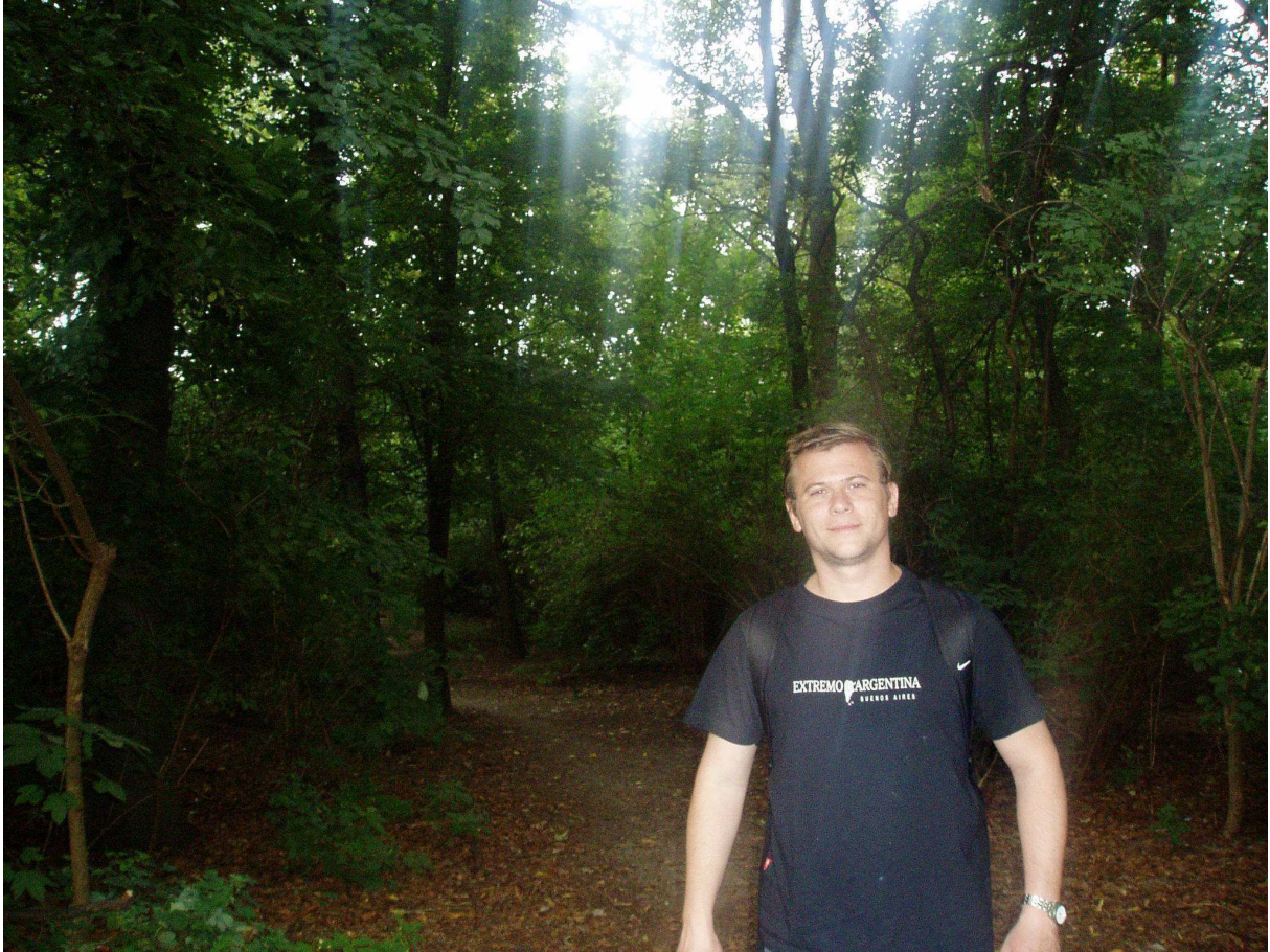
El autor, en Agosto de 2011.

Es el autor de varios libros ( “Cuestiones Demológicas”, “Los Grandes Paradigmas Históricos y el Estudio de los Fenómenos Sociales”, “Meditaciones Sociológicas. Confesiones de un Argentino Preocupado”, etc.) y de numerosos artículos sobre diversos temas de Filosofía Política, Geopolítica, Política Internacional, Derecho Político y Derecho Constitucional. Materias, éstas, en relación a las cuales también ha dictado gran cantidad de conferencias en el ámbito de la Facultad de Derecho y Ciencias Sociales del Rosario (P.U.C.A.), la Facultad de Ciencias Económicas del Rosario (P.U.C.A.), el Colegio de Abogados de Rosario, el Círculo de Legisladores de la Nación, etc.