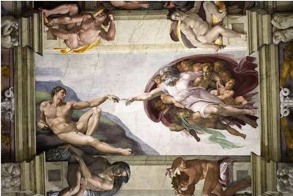
La creación del hombre, según el fresco que el genial MIGUEL ÁNGEL pintó en el techo de la Capilla Sixtina, en el Vaticano.

Durante siglos, Europa Occidental ha constituido el “ corazón ” de nuestra majestuosa civilización, formada a partir de los enjundiosos acervos étnicos y culturales legados por los antiguos griegos, romanos y germanos. Pueblos, éstos, recíprocamente emparentados, desde sus mismos orígenes, por la “ sangre ”, el “ suelo ” y el “ espíritu ”.