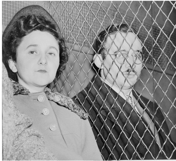
El matrimonio Rosenberg.

Fue en uno de estos juicios que fueron condenados a muerte Julius Rosenberg y su esposa, Ethel Greenglass . La ejecución tuvo lugar el 19 de Junio de 1.953.