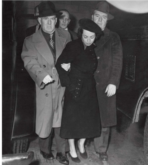
04/03/49: el FBI arresta a Coplon.

¿Acaso no fue el actor comunista Dalton Trumbo quien escribió el discurso con el cual el Secretario de Estado Edward R. Stettinius se expidió en la apertura de Naciones Unidas?