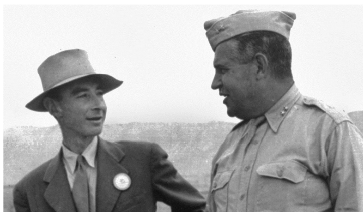
Oppenheimer con el general Leslie Richard Groves, encargado de la seguridad del proyecto Manhattan , luego de la prueba Trinity (primera prueba de un arma nuclear en EE.UU.; 16/07/45).

Asimismo, de las investigaciones desarrolladas en base a las revelaciones de Gouzenco , surgió la complicidad de Bruno Pontecorvo , quien también trabajaba en el centro de Harwell. El profesor Pontecorvo logró escaparse y refugiarse en la