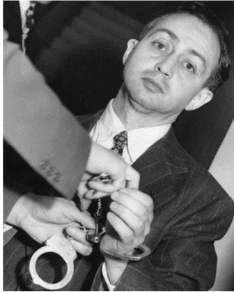
Heinrich Golodnostkiy, más conocido como Harry Gold.

- David Greenglass (espía atómico de la Unión Soviética; trabajó en Los Álamos National Laboratory , en el proyecto Manhattan ; hermano de Ethel Greenglass Rosenberg ; su testimonio contribuiría a incriminar a su propia hermana y a su cuñado; pasaría nueve años y medio en prisión).