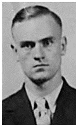
Ígor S. Gouzenko.

Muñido de 109 documentos oficiales que puso a disposición de las autoridades canadienses, el desertor reveló a las mismas la existencia de una vasta y compleja red de espionaje tendida en contra de su país, el Reino Unido y EE.UU.