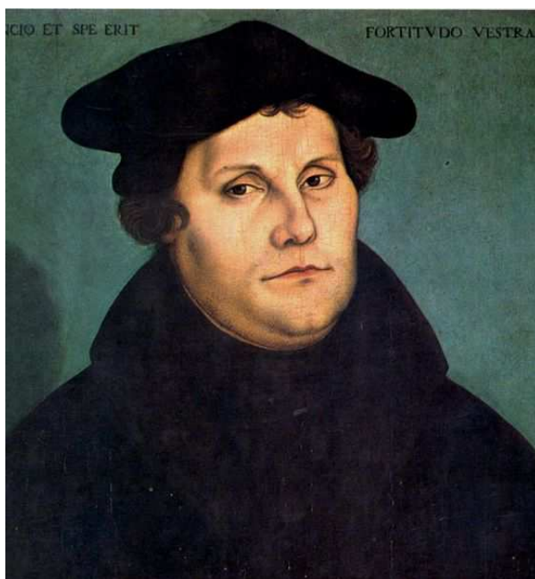
Martín LUTERO. (10)

Esta hermenéutica heterodoxa elaborada por LUTERO influyó decisivamente en el pensamiento hegeliano. En efecto, la concepción dialéctica elucubrada por el filósofo alemán (consistente en un supuesto movimiento circular de tres fases: tesis, antítesis y síntesis) se encuentra apoyada de manera especial sobre la peculiar interpretación luterana acerca de la Encarnación del VERBO de DIOS. Interpretación, ésta, según la cual DIOS (tesis), al hacerse carne , se aliena de Sí Mismo, negándose (antítesis), para -luego de Su Muerte y Resurrección- ser exaltado en Su Iglesia y junto con ella (síntesis).