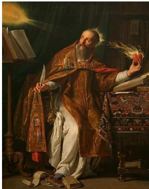
SAN AGUSTÍN DE HIPONA. (7)

Esta doctrina católica reconoce antiguos y prestigiosos antecedentes. Ha sido abonada, entre otros, por SAN BASILIO, El Grande (330/379), TITO DE BOSRA (m. en 370), SAN JUAN CRISÓSTOMO (344/407) y, muy especialmente, SAN AGUSTÍN de Hipona (354/430). Este último ha desarrollado la doctrina del mal como privatio boni en los cinco tratados que redactó contra el Maniqueísmo entre los años 388 y 399.