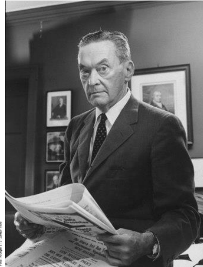
Ernst Bloch, docente y escritor utopista de base marxista. Walter Lippmann, periodista y analista político (premio Pulitzer , 1958 y 1962).