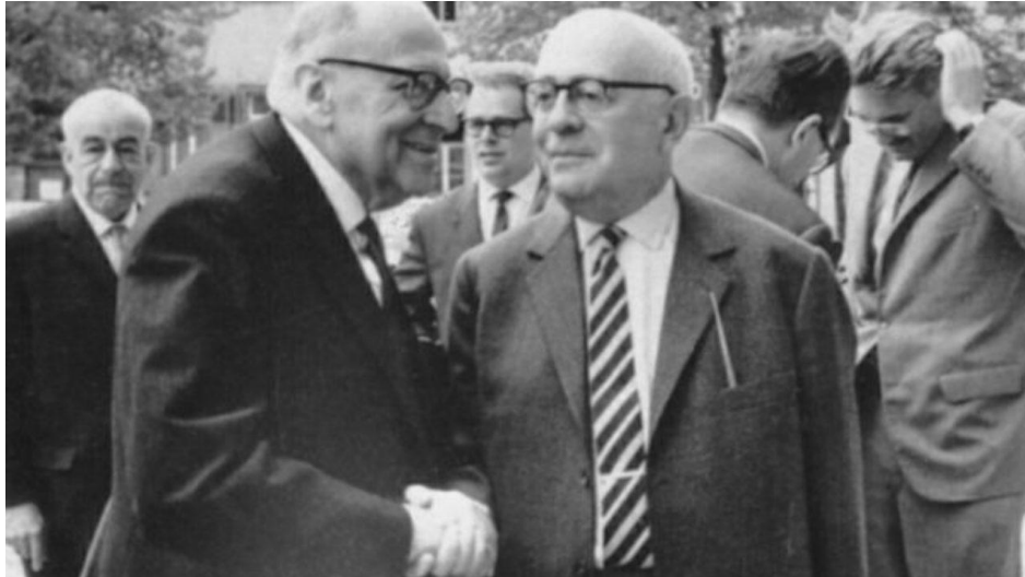
Max Horkheimer saluda a Theo Adorno (detrás, llevando la mano hacia su cabello, un joven Jürgen Habermas).