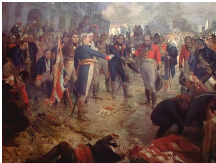
Rendición de las fuerzas británicas, comandadas por el General William C. BERESFORD, en Buenos Aires, el 20 de Agosto de 1.806.

En resumidas cuentas, aquello que los británicos no habían podido lograr por la fuerza de sus armas en 1.806 y 1.807, finalmente lo obtuvieron gracias a su proverbial astucia política (constituida, básicamente, por sagaces despliegues de inteligencia, una magistral capacidad para la planificación estratégica y habilísimas maniobras diplomáticas) y también su enorme poderío económico.