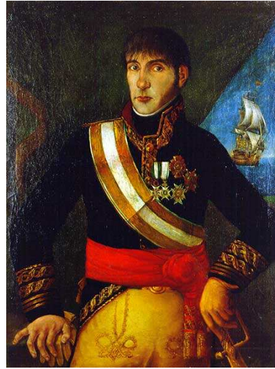
Juan RUIZ DE APODACA y Baltasar CISNEROS.