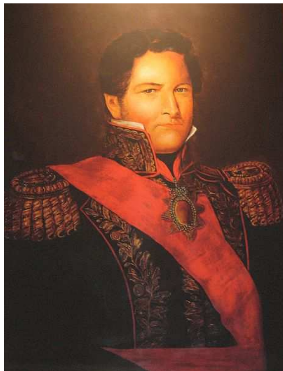
Juan Manuel DE ROSAS, “ Restaurador de las Leyes ” y “ César de la Pampa ”. (8)