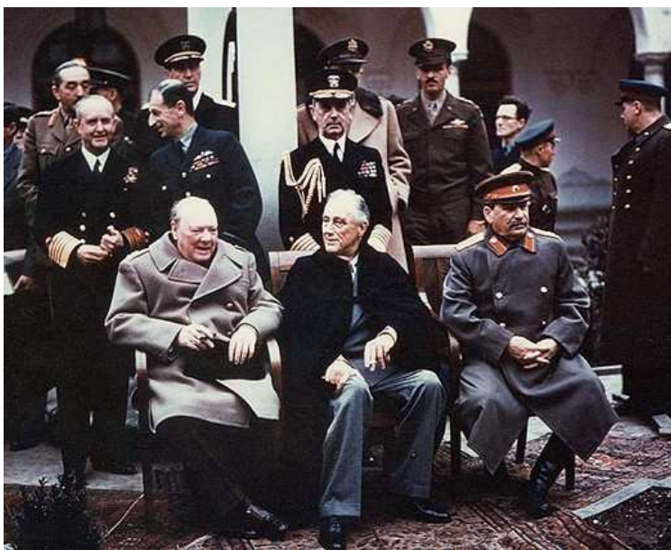
Winston CHURCHILL en la Conferencia de Yalta (1.945), junto a Franklin DELANO ROOSEVELT y Josef STALIN.

- En Septiembre de 1.955, en la Cámara de los Comunes, el mismo CHURCHILL expresó: “La caída del tirano Perón en Argentina es la mejor reparación al orgullo del Imperio y tiene para mí tanta importancia como la victoria de la Segunda Guerra Mundial, y las fuerzas del Imperio Inglés no le darán tregua, cuartel ni descanso en vida, ni tampoco después de muerto” . (21)