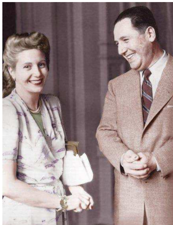
Juan D. PERÓN y su señora, Eva DUARTE DE PERÓN.

Desafortunadamente, la imagen que gran parte del mundo tiene del General PERÓN y su señora esposa, Eva DUARTE DE PERÓN, se encuentra grotescamente distorsionada, cuando no por enconados detractores, a través de interpretaciones torpemente descontextualizadas. Uno de los factores que más ha contribuido a que se produjera tamaña distorsión fuera de Argentina, es el musical “ Evita ”, de Andrew LLOYD WEBBER y Tim RICE. Lo mismo cabe decir de la película estadounidense del mismo nombre, aparecida en 1.996, la cual fuera escrita, producida y dirigida por Alan PARKER.