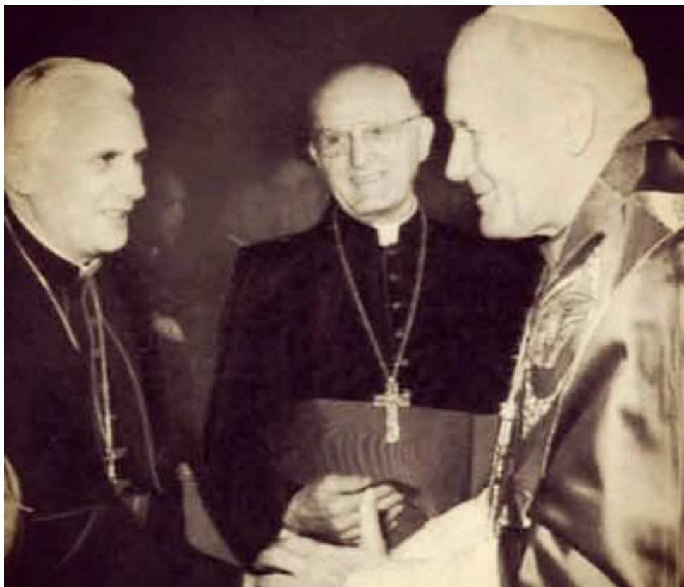
El Papa JUAN PABLO II junto con el Cardenal Joseph RATZINGER (futuro Papa BENEDICTO XVI) y el Cardenal Edouard GAGNON. (36)

Dietrich VON HILDEBRAND cumpliría con la proposición de PABLO VI. Escribiría un extenso documento, el cual sería entregado al Pontífice en Septiembre de 1.965, justo en el día previo a la última sesión del Concilio Vaticano II. Más tarde, PABLO VI diría al sobrino del teólogo -a la sazón,