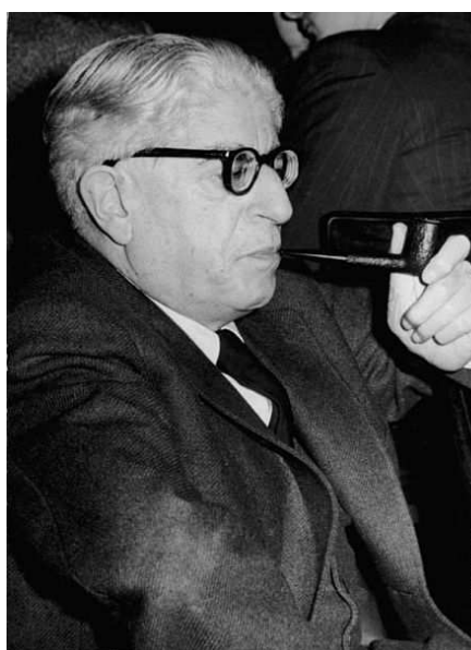
Ernst BLOCH. (41)

depositada en la Divina Providencia para reposar en el mito positivista del progreso (histórico) indefinido (mito ideológico, éste, del cual el marxismo es legatario ); y la Caridad dejó de estar fundada en el Amor para acoplarse a la mecánica perversa de la lucha de clases . No en vano, Dietrich VON HILDEBRAND pasó largos años de su vida denunciando la pérdida del sentido de lo sobrenatural en el seno mismo de la Iglesia. (40)