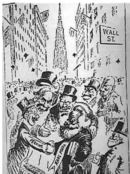
Caricatura de 1.911 en la que aparece Karl MARX vitoreado por los capos de la alta finanza en Wall Street. (18)