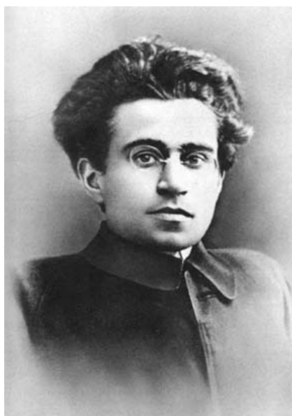
Antonio GRAMSCI. (39)

Complementariamente, el filósofo judeo-alemán Ernst BLOCH elucubró la estrategia de inmanentizar las virtudes teologales cristianas, replanteándolas despojadas de toda significación auténticamente trascendente. Producto de esta tergiversación, la Fe dejó de estar orientada a DIOS para focalizarse en el hombre; la Esperanza dejó de estar tanto clase dominante contemporánea), siendo reemplazada por el sentido de trascendencia de los hombres, independientemente de su clase social y de cualquier otra de sus dimensiones existenciales.